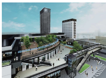
■多治見駅南地区第一種市街地再開発事業 完成予想CG